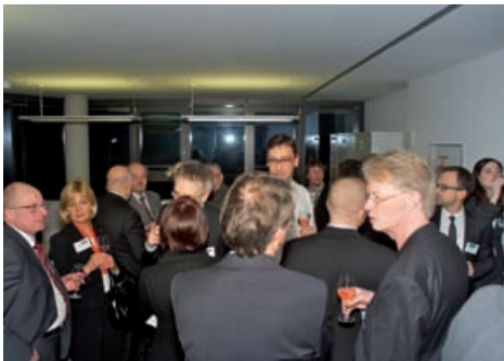
Die Gäste beim Empfang mit einem Glas spritzig, fränkischen Secco, spendiert und serviert vom Winzerhof Hofmann aus Egersheim.