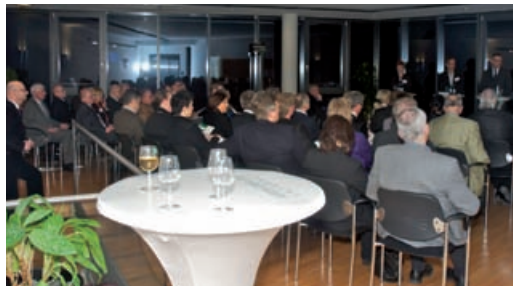
Full House: Die Gäste verfolgen aufmerksam die Podiumsdiskussion.